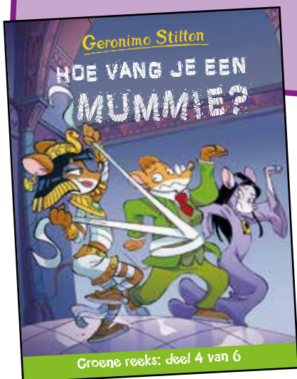
Hoe vang je een mummie? - € 9,95 verschijnt op 15 december 2015

Je slaapkamer is overdag zo gezellig, maar 's avonds lijken je wapperende gordijnen wel spoken. Bang zijn in het donker is heel gewoon. In het donker kun je amper iets zien. En wat je niet kunt zien, maakt je bang. Maar als je gewoon even je lampje aandoet, dan zul je merken dat alles er heel normaal uitziet en er heus geen monsters onder je bed zitten.