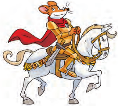
Ridder zonder Vrees of Blaam

De feniks onderbrak me: ‘Ik kan je verder niets vertellen: mijn opdracht is je op te halen, nu! Zij heeft gezegd, al was het meer een bevel, dat je onmiddellijk moest komen!’